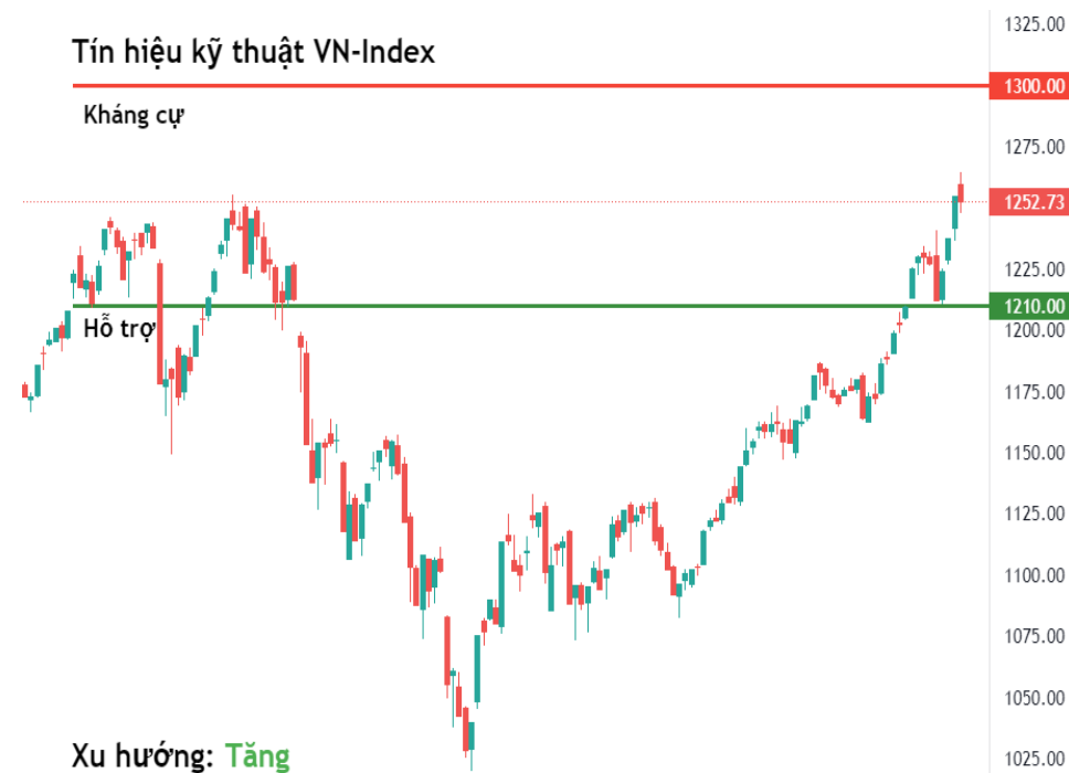
Tín hiệu kỹ thuật VN-Index