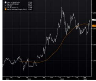
Lịch sử P/B của VCB