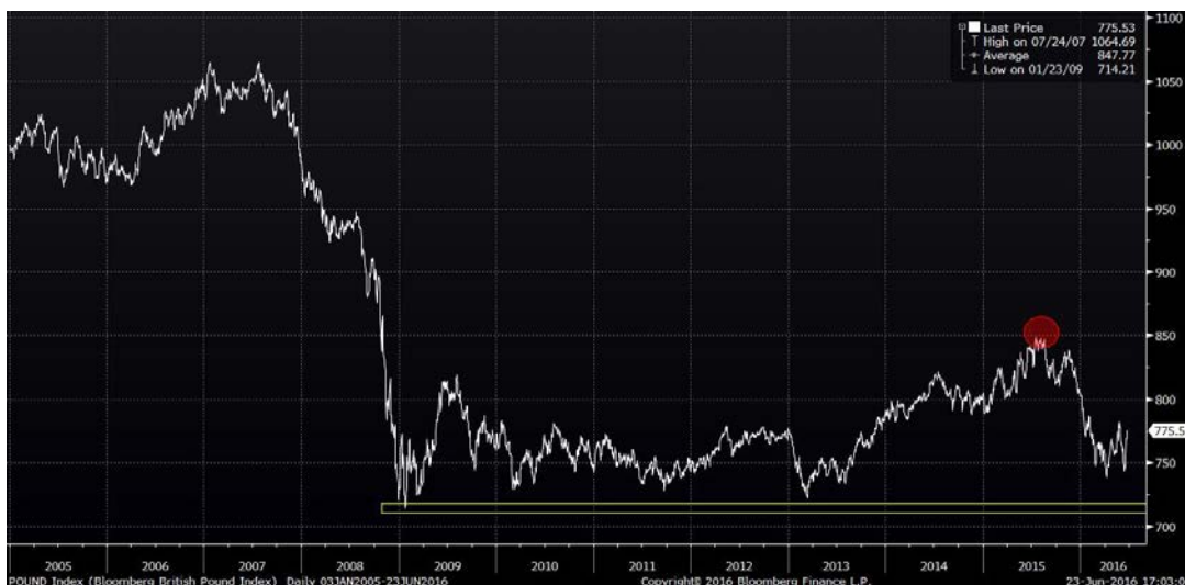
Hình: Diễn biến British Pound Index

Ở một quan sát khác, chúng tôi nhận thấy chỉ số đồng bảng Anh – British Pound Index có xu hướng tăng trở lại gần đây sau khi giảm khá mạnh kể từ tháng 7/2015 khi Thủ tướng Anh David Cameron tuyên bố tổ chức cuộc trưng cầu dân ý cho vấn đề Brexit. Sự phục hồi này cùng với kết quả sơ bộ hiện tại cho thấy khả năng rời khỏi EU giảm xuống. Có thể những thông tin này là yếu tố giúp cho tâm lý giao dịch ngày hôm nay tốt hơn ngoài mong đợi.